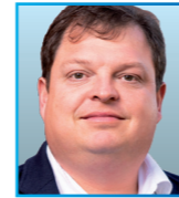
Listenplatz 1: Hannes Loth 42 Jahre Bürgermeister Retzau